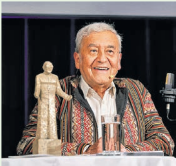
Sonntagsblatt / Gerd Neuhold